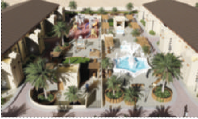
تطوير المرافق لخدمة الشباب